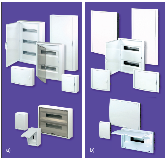
Obr. 2. a) Nástěnné rozvodnice RNG, b) Zapuštěné rozvodnice RZG

deny na trh oceloplechové rozvodnice do 198 modulů, a to v zapuštěném provedení RZB a nástěnném RNB. A od 1. července 2011 byla značka DistriTon rozšířena o sortiment nových plastových rozvodnic (obr. 1). Jde o rozvodnice nástěnné a zapuštěné. Zároveň pod značku DistriTon byly přiřazeny i rozvodnice ECO s krytím IP55, které jsou