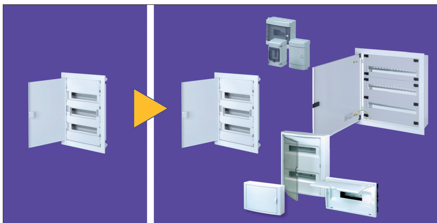
Obr. 1. vlevo – 2010 RZA, vpravo – 2011 RZA + RZB, RNB, RZG, RNG, ECO

Ve standardní výbavě rozvodnic nechybí svorkovnice PE a N (obr. 4), které lze upevnit k základně nahoru nebo dolů. Zároveň základní výbava rozvodnic zahrnuje i menší