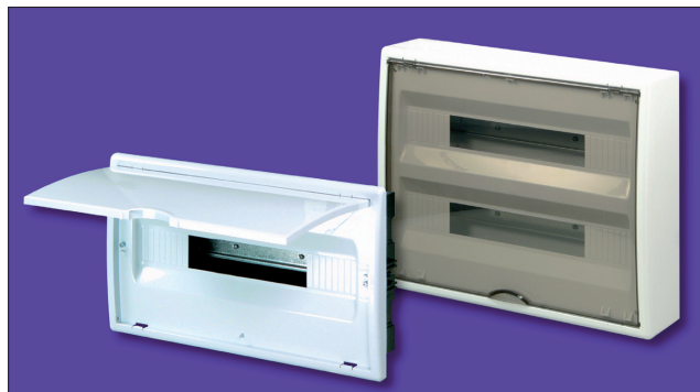
Obr. 3. Rozvodnice pro 18 a 40 modulů

V novém sortimentu se podařilo nejen podstatně rozšířit nabízené velikosti, ale i zvýšit maximální počet přístrojů pro osazení rozvodnic běžných velikostí. Takto u obou pro-