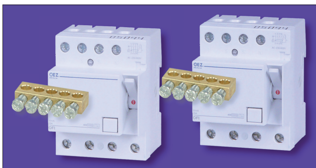
Obr. 4. N svorkovnice pro proudové chrániče

svorkovnice N pro připojení až pěti vodičů za čtyřpólovým proudovým chráničem. Při nedostatečném počtu přípojních míst je možné tyto svorkovnice doplnit jako příslušenství.