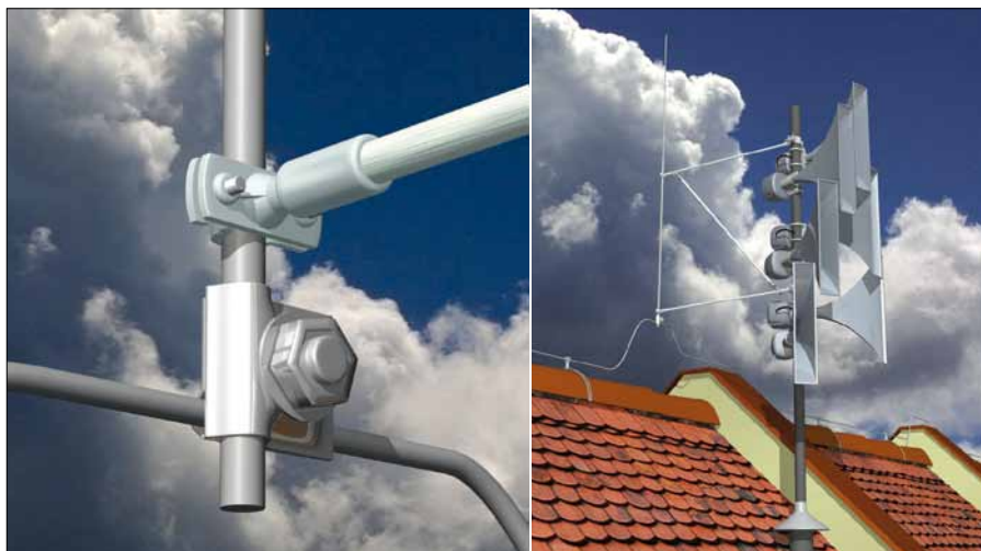
Obr. 1. Konstrukční prvky DEHNiso Combi

V posledních několika letech se investovaly obrovské finanční prostředky do systému včasného varování (sirény) obyvatelstva před různými katastrofami ať již způsobenými lidmi nebo přírodou. Jak je v našich podmínkách běžné mnohdy bez ohledu na ochranu před bleskem, a to i v těch případech, kdy by stačilo udělat opravdu velmi málo. Vzhledem k ceně instalovaného zařízení se vyplatí zvažovat nejenom ochranu majetku a osob pod takovouto sirénou, ale i ochranu sirény samotné, a to navíc v okamžiku, kdy je výrobcí těchto sirén ochrana před bleskem opakovaně v dokumentech vyžadována.