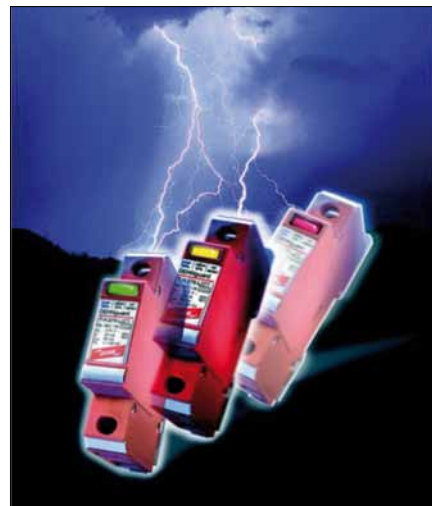
Obr. 5. Svodiče přepětí DEHNguard LI

Dále je třeba věnovat pozornost provoznímu napětí vodičů vedoucích k reproduktorům. Pohybuje-li se v rozmezí hodnot do 48 V, nezbuďte nic jiného, než použít svodič bleskových proudů DEHNbloc M 150 (obj. č. 961110) pro potenciálové vyrovnání všech vodičů. Jejich průřez se u případů, se kterými jsme se setkali, pohyboval mezi 1,5 až 2,5 mm 2 – takovéto vodiče se při průchodu bleskového proudu většinou neodpaří. Bohužel vzhledem k tomu, že fyzika funguje tak, jak nás na základní škole učili – a tento článek je toho důkazem – je třeba vytvořit pro tyto svodiče místo, které by mělo být co nejbližší vstupu pod střechu. Pro jejich správnou funkci je třeba natáhnout od HEP (hlavní ekvipotenciální přípojnice) měděný vodič 16 až 25 mm 2 , a to nejlépe dvěma slaněnými vodiči.