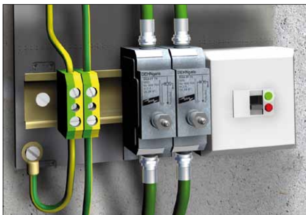
Obr. 4. Ochrana anténních vodičů svodičem přepětí DEHNgate FF TV

ních prvků DEHNiso Combi (obr. 1). Jde o set X2-A200, stejně jako v případě ochrany antény.