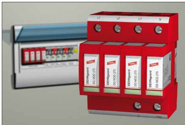
Obr. 3. Ochrana vstupních vodičů svodičem přepětí DEHNguard

Při ideální kombinaci je snaha nejprve vytvořit oddálený hromosvod co nejjednodušší, a to za pomoci spolehlivých konstrukcí-