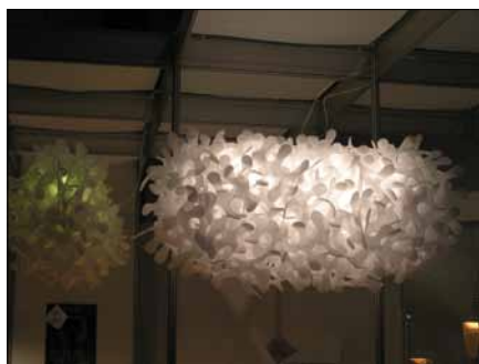
Obr. 7. Závěsné dekorativní svítidlo Oblak (přihlašovatel Media Trading) – druhé místo v kategorii Svítidlo do interiéru

V kategorii Svítidlo do interiéru (sedm svítidel) byly uděleny ceny dvě, včetně jedné Zvláštní ceny poroty. Zvláštní cenu poroty získalo zajímavě ztvárněné stropní závěsné svítidlo UFO (přihlašovatel