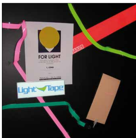
Obr. 6. Světelný pás (přihlašovatel Maxistore) – první místo v kategorii Svítidlo do interiéru

vý příkon je 90 W, teplota chromatičnosti 6 300 K, třída ochrany I, krytí IP66. Toto svítidlo získalo také jednu z cen Grand Prix For Arch 2009.