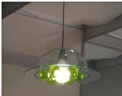
Obr. 8. Závěsné svítidlo UFO (přihlašovatel SPŠS v Kamenickém Senově) – Zvláštní cena poroty For Light v kategorii Svítidlo do interiéru

lze osadit zářivkou nebo diodami LED na bázi RGB. Porotu zaujalo především svým účelem využití, v oboru světelné techniky netradičním. Je totiž určeno do velkých prostor (např. hotelové haly), kde plní funkci tzv. pohlcovače rušivých zvuků. První místo (průměrné hodnocení 22 bodů) získal Světelný pás (přihlašovatel Maxistore), pracující na principu elek-