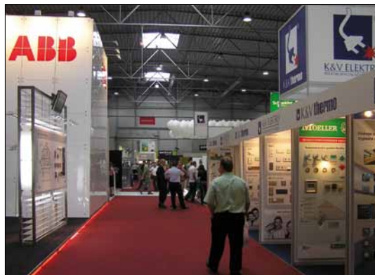
Obr. 1. Pohled mezi expozice For Elektro v hale 6