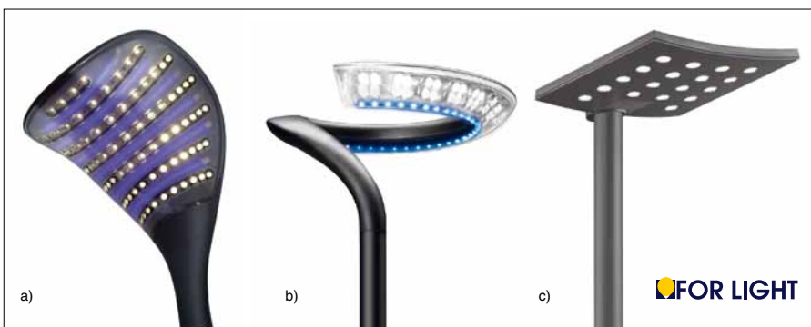
Obr. 9. Svítidla oceněná v soutěži For Light v kategorii Svítidlo do exteriéru a) svítidlo Kobra (přihlašovatel Siteco) – první místo b) svítidlo Perla (přihlašovatel Artechnic-Schröder) – druhé místo c) svítidlo Stela (přihlašovatel Indal) – třetí místo

Na třetím místě (průměrné hodnocení 20 bodů) skončilo svítidlo Stela (přihlašovatel Indal), osazené světelnými zdroji LED, které zaujalo porotu moderním elegantním ztvárněním. Tělo svítidla včetně světelné části vytváří esteticky dokonale sladěný kompaktní celek. Druhé místo (průměrné hodnocení 21 bodů) získalo svítidlo Perla (přihlašovatel Artechnic-Schröder), které může být osazeno 48 nebo 64 světelnými diodami LED o příkonu 1,2 W, stupňovitě stmívatelné a určené k osvětlování prostranství, pěších zón, parků apod. - více na str. 38. První místo