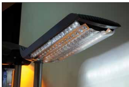
Obr. 5. Venkovní svítidlo Advision (přihlašovatel Brilum), oceněno v kategorii Prototypy; svítidlu byla udělena také jedna z cen Grand Prix For Arch 2009