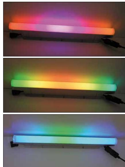
Obr. 10. Svítidlo iColor Accent Powercore (přihlašovatel Philips), absolutní vítěz soutěže For Light 2009

(průměrné hodnocení 22 bodů) získalo venkovní svítidlo Kobra (přihlašovatel Siteco) velmi zajímavého tvarového řešení, které zajišťuje optimální rozložení světelného toku, plně srovnatelné s vlastnostmi klasických svítidel, osazené světelnými diodami (více viz Světlo 6/2008, str. 9). Absolutním vítězem letošního ročníku soutěže For Light s celkově nejvyšším počtem