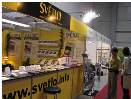
Obr. 2. Se svými dotazy ohledně veřejného osvětlení se mohli příchozí obracet přímo na zástupce členů Společnosti pro rozvoj veřejného osvětlení ve společné expozici umístěné vedle stánku časopisů Světlo a Elektro (FCC Public, vydavatelství časopisů Automa, Elektro, Světlo a odborných publikací)